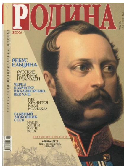
Российский исторический журнал